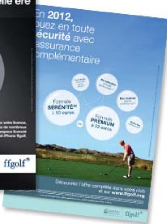
Affiche assurances complémentaires

Deux affiches à mettre en place dans votre club house