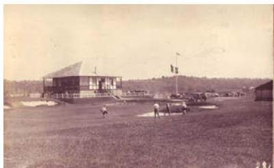
Le club house en 1919...