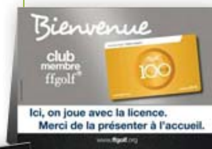
Chevalet de comptoir